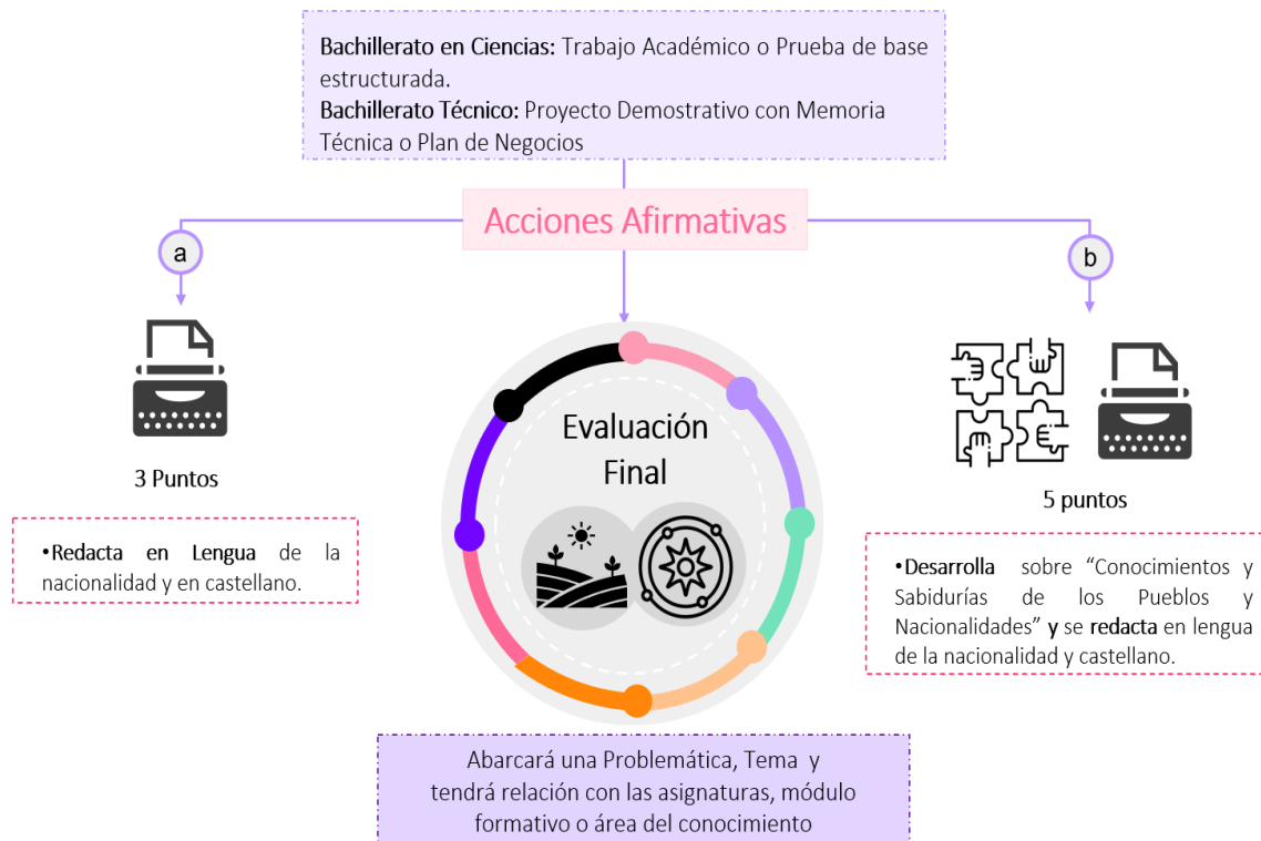
Gráfico 2: Reconocimiento de los Trabajos Académicos realizados con Enfoque Intercultural Bilingüe

Elaborado: Equipo técnico de la Dirección Nacional de Bachillerato, 2024.